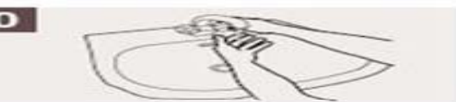
Mójese las manos.

1 Duración del lavado: entre 40 y 60 segundos