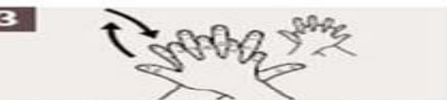
Frótese la palma de la mano derecha contra el dorso de la mano izquierda entrelazando los dedos, y viceversa.