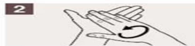
Frótese las palmas de las manos entre sí.