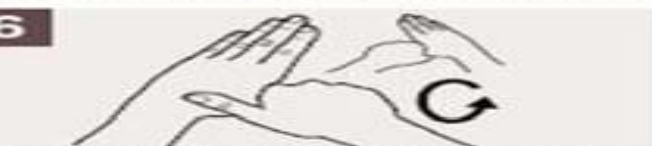
Rotando el pulgar izquierdo con la palma de la mano derecha, fróteselo con un movimiento de rotación, y viceversa.