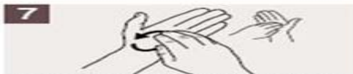
Frótese la punta de los dedos de la mano derecha contra la palma de la mano izquierda, haciendo un movimiento de rotación, y viceversa.