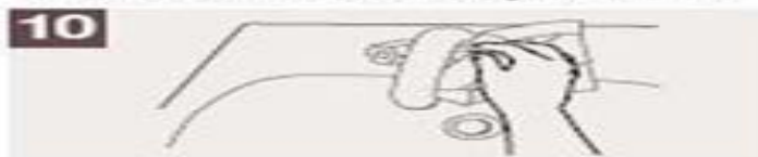
Utilice la toalla para cerrar el grifo.