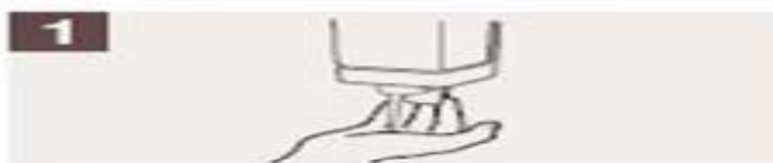
Aplique suficiente jabón para cubrir todas las superficies de las manos.