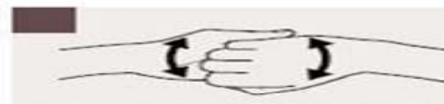
Frótese el dorso de los dedos de una mano contra la palma de la mano opuesta, manteniendo unidos los dedos.