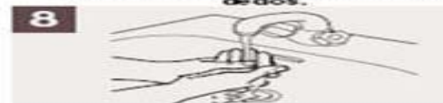
Enjuáguese las manos.