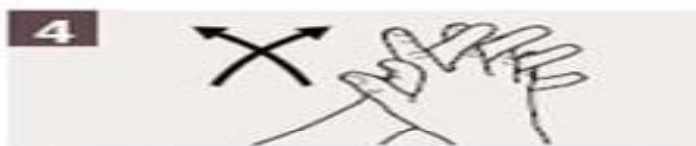
Frótese las palmas de las manos entre sí, con los dedos entrelazados.