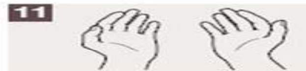
Sus manos son seguras.