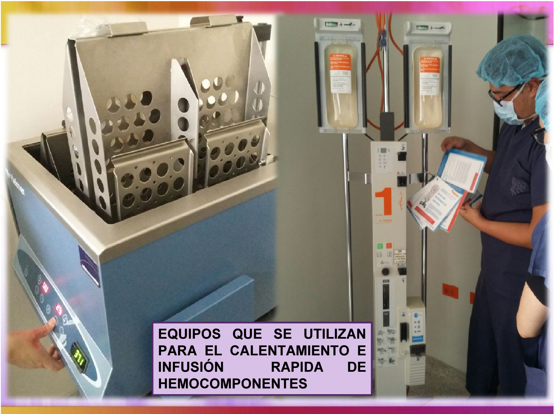
EQUIPOS QUE SE UTILIZAN PARA EL CALENTAMIENTO E INFUSIÓN RÁPIDA DE HEMOCOMPONENTES