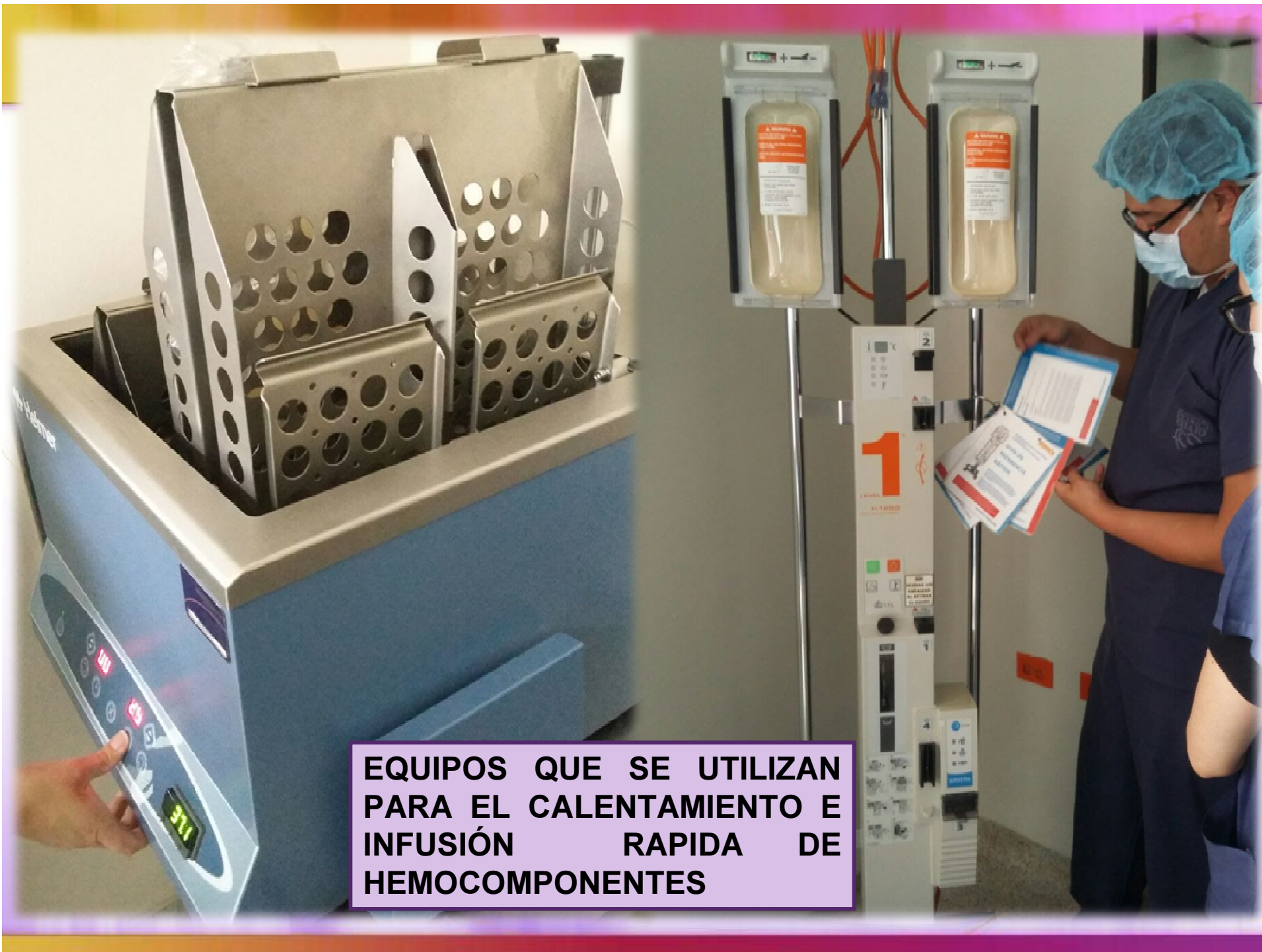
EQUIPOS QUE SE UTILIZAN PARA EL CALENTAMIENTO E INFUSIÓN RÁPIDA DE HEMOCOMPONENTES