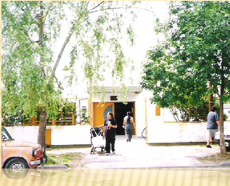
UNIDAD SANITARIA 101