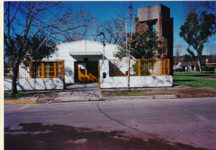
UNIDAD SANITARIA MOSCONI