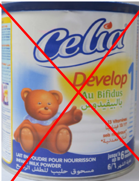
Formula infantil (0 a 6 meses)