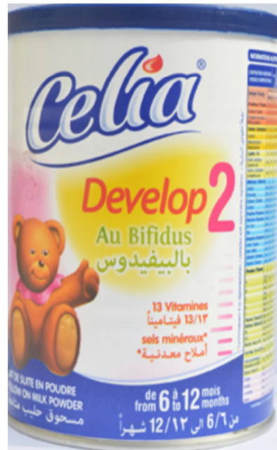
Formula de seguimiento (6 a 12 meses)