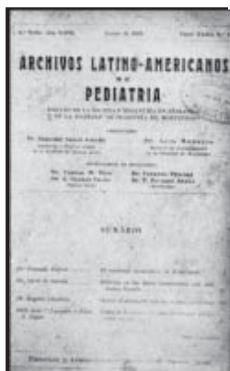
FIGURA 1. Portada del último número de Archivos Latino-Americanos de Pediatría, enero 1929