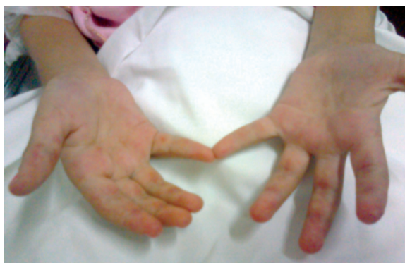
FIGURA 1. Fotografía de las manos de la paciente en el día 2 de internación

Las manifestaciones clínicas más destacadas son: anorexia, pérdida de peso, cansancio, fiebre, debilidad muscular simétrica de predominio proximal, afección de la musculatura faríngea e hipofaríngea, dolor a la palpación en áreas musculares, edema, eritema en párpados en heliotropo y pápulas de Gottron. Otras incluyen fotosensibilidad, eritema malar y palmar, calcificaciones en piel o tejido celular subcutáneo, dolor abdominal, hemorragia digestiva, neumonía, pericarditis, miocarditis, artritis simétrica, microhematuria, trastornos de la conducta, hipertensión y fenómeno de Reynaud. Es muy rara la asociación de dermatomiositis juvenil con neoplasias. 2