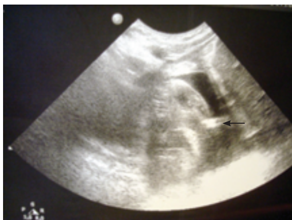
FIGURA 2. Ecocardiograma que muestra sombra acústica en cavidad pericárdica que corresponde a punta de catéter distal enclavada en ventrículo derecho (flecha).

La colocación de válvulas de derivación ventricular es una práctica frecuente en pediatría. A