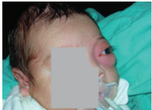
FIGURA 1. Paciente con eritema periorbitario y proptosis.

Recibió inicialmente cefotaxima endovenosa. A las 48 h se informó desarrollo en hemocultivos de SAMR-CO (resistente a meticilina, sensible a vancomicina, clindamicina, teicoplanina, eritromicina, trimetoprima/sulfametoxazol y