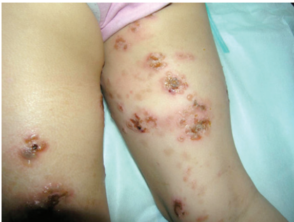
FIGURA 4. Nótese la afectación bilateral

Para finalizar, queremos resaltar la importancia de la alerta que debe tener el pediatra frente a los casos más frecuentes de lesiones ampollares de la infancia que no responden al