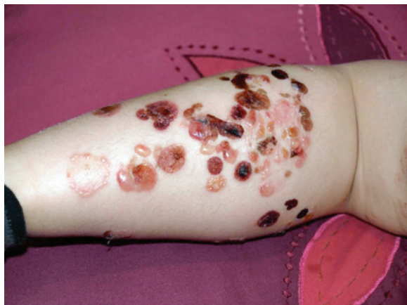
FIGURA 2. Visión panorámica. Se evidencia el polimorfismo lesional en relación con el tiempo de evolución de las ampollas y el clásico collar de perlas