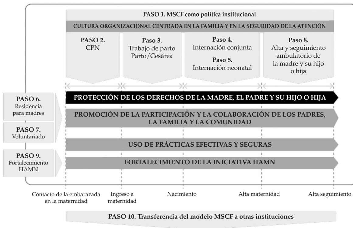
FIGURA 2. Ejes y pasos para la implementación de Maternidad Segura y Centrada en la Familia

Fuente: Larguía M, González MA, Solana C, Basualdo MN, Di Pietrantonio E, Bianculli P, Ortiz Z, Cuyul A, Esandi ME. Maternidad segura y centrada en la familia (MSCF) con enfoque intercultural. Conceptualización e implementación del modelo. 2 da ed. Buenos Aires: UNICEF, Fundación Neonatológica, Maternidad Sardá, Ministerio de Salud de la Nación; 2012.