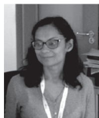
Dra. Sema Mandal Especialista en epidemiología, Infectología, y salud pública. Miembro del departamento de inmunizaciones del Ministerio de Salud Publica de Inglaterra (PHE) (Reino Unido)