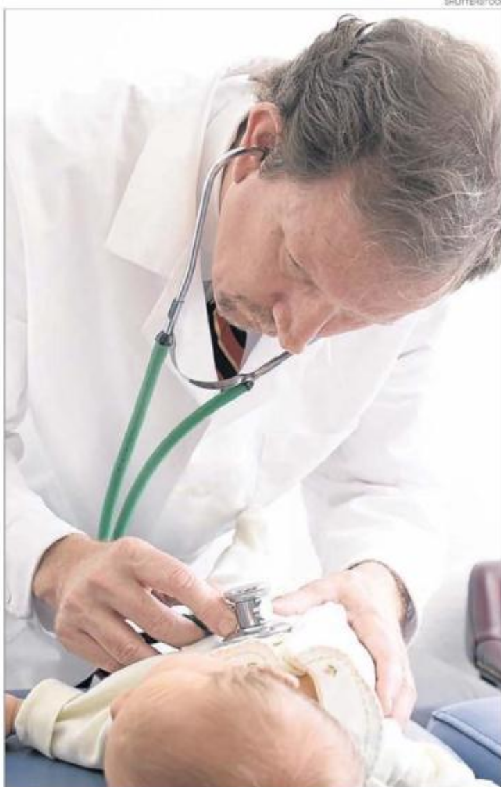
CONTRADICCIÓN. La pasión choca con los problemas cotidianos.

El salario es el principal elemento de insatisfacción que los lleva al politrabajo, con una carga horaria promedio de 47