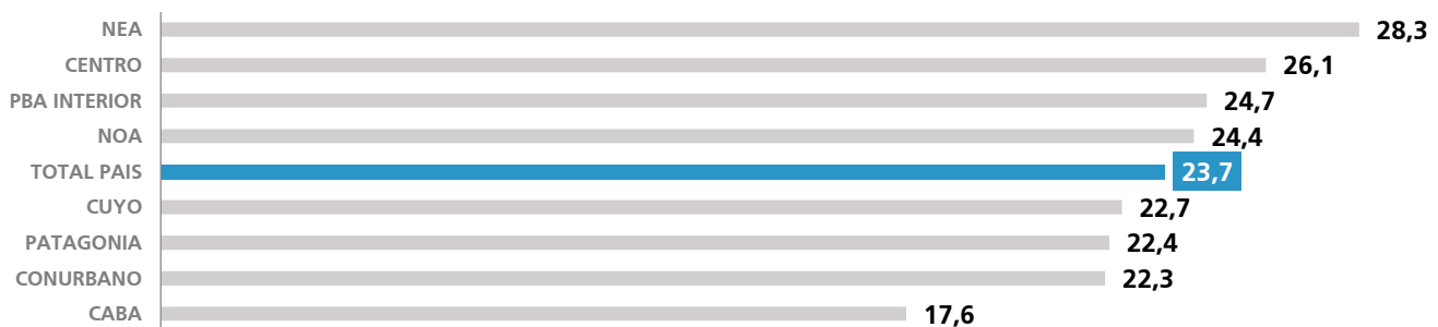
GRÁFICO 1. MADRE ADOLESCENTE (%)

Así, en la región del noreste argentino (NEA) se registra una brecha de 60% más de embarazos en adolescentes comparado con CABA (28.3% vs 17.6%), siendo casi 500% superior la proporción de madres menores de 15 años (1.36% vs 0.29%) entre las regiones mencionadas. 3 Si se analizan las brechas interprovinciales, se observa una proporción 70% mayor de embarazos en adolescente en Misiones, comparado con CABA y de más del 500% en madres menores de 15 años en Formosa comparada con la capital del país. 3 (Gráfico 1 y 2)