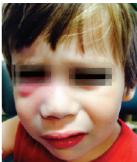
FIGURA 2. Lesión fluctuante en la región gingivolabial superior derecha