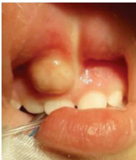
FIGURA 2. Lesión fluctuante en la región gingivolabial superior derecha