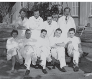
En el Niños, que "simboliza un enorme bagaje de esperanzas" (1952).