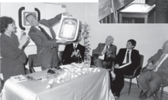
En la SAP, con sus colegas, recibiendo de J. Grant la Medalla y el Certificado de Honor que Unicef otorgó a la Sociedad (1992)