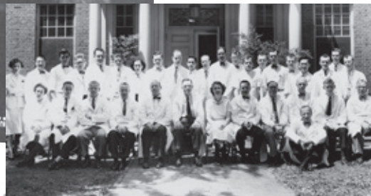
En el St. Christopher's Hospital, Filadelfia, como becario y Jefe de Residentes (1955).